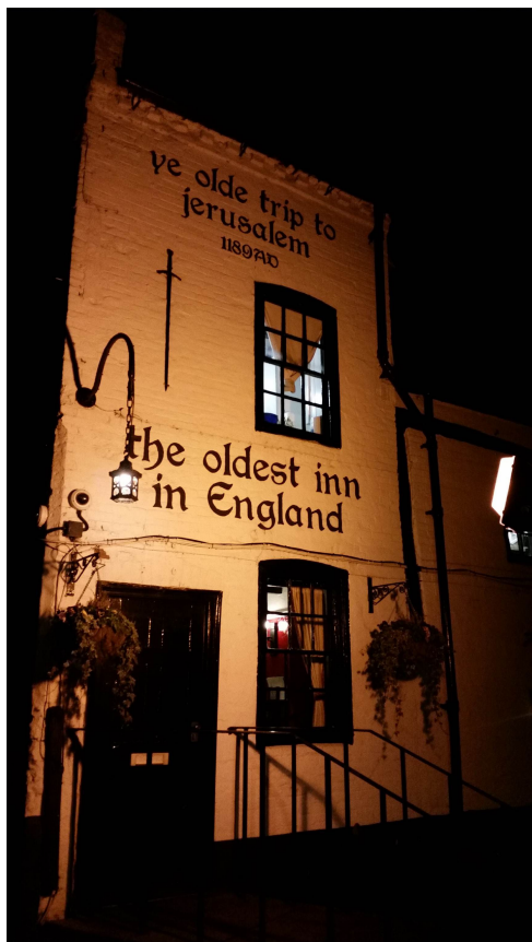
英国最古老的酒吧“耶路撒冷”

早餐方面，英国人的饮食讲究营养均衡搭配。餐点包括面包、加了麦片的牛奶、鸡蛋以及附赠的果酱等。午餐方面，英国人的午餐吃的比较简便，交流的同学也会选择自带简单的食物，经过微波炉加热后，在餐厅食用。也有同学会在学校餐厅购买午餐，但价格会稍贵。晚餐方面，英国人的习惯和中国人的习惯大体相似，都把这一餐当作正餐。但