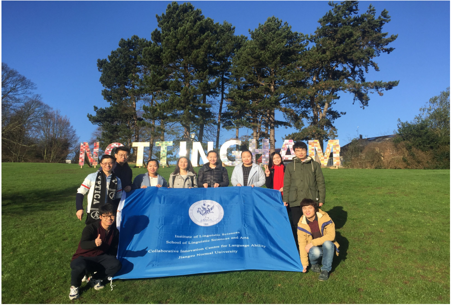
诺丁汉大学主校区 (University Park)