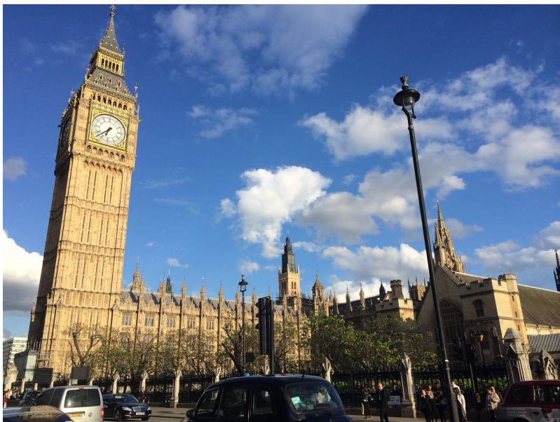
伦敦威斯敏斯特教堂

去过英国的人，都会被古老神秘的城堡、底蕴深厚的大学和庄严肃穆的教堂所震撼，但是与城堡和大学相比，让我们最惊讶地还是数量众多的教堂。教堂是伴着英国人的宗教信仰和精神追求而建立起来的，也与英国人的日常生活息息相关。英国人一生中重大事件都离不开教堂。教堂文化，让我们感受了英国人于远在东方的中国人不同的人生价值观。