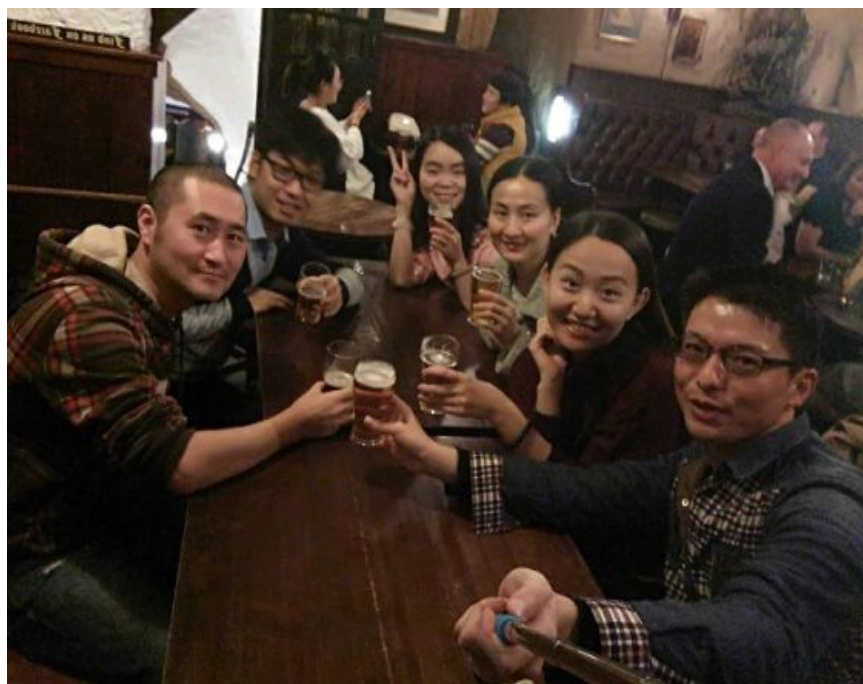
在英国最古老的酒吧“耶路撒冷”（Ye Olde trip to jerusalem）

在英国，下班和朋友或同事去酒吧喝酒是一种文化。我们的习大大访英期间，英国首相卡梅伦也邀请他去酒吧喝了一杯。传说，英国文学就是起源于酒吧，莎士比亚是酒吧的常客，常常边喝酒边写剧本，而且酒吧也是狄更斯作品中的一道风景线。而在国内，酒吧文化一般不太被接受。当我们走进英国酒吧，看到的不是嘈杂与混乱，感受到的是闲情与逸致，认识不认识的人都在畅快地边喝酒边聊天，空气中弥漫着慵懒与激情，仿佛是古典与现代的碰撞。