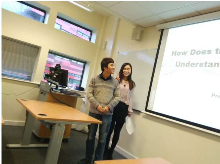
会议演讲准备阶段

册，以供不同观众根据个人爱好选择参加会议的时间和地点。学生需根据个人论文，联系会议的主题进行一个学术演讲，向同学和教师介绍个人研究领域以及新近的研究和发现，历时 15-20 分钟。演讲结束后，同学和教师会针对演讲内容进行提问，个人需要进行答疑。整个过程也是事先征得学生同意，全程录制。有两名教师按照考核要求，分别进行打分。会议演讲在第九周星期四进行考核。