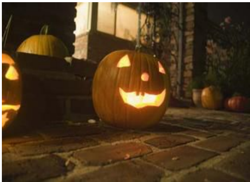
万圣节诺丁汉居民屋外的南瓜灯

万圣节由来。古时的凯尔特人认为 10 月 31 日是夏天正式结束的日子，也就是新年伊始，寒冷的冬天正式开始的时候。那时人们相信，故人的灵魂会在这一天回归故里，在活人身上寻找生灵。而活人惧怕鬼魂，于是人们在这一天会熄灭灯火，让鬼魂无法找到活人，又把自己打扮成妖魔鬼怪的样子把鬼魂吓走。所以大部分西方人以恐怖打扮来庆祝万圣节。随着时间流逝，万圣节的意义逐渐起了变化，变得积极快乐起来，喜庆的意味成了主流。