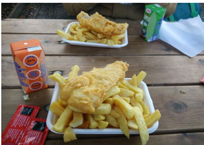
英国国菜：炸鱼薯条（Fish and Chips）

临近课程尾声，同学们已经能适应当地的饮食习惯，尤其是英国的特色美食——炸鱼薯条和带着浓浓奶酪的披萨。同时，赴英交流同学也会在闲暇之余，自己动手制作中国的美食，然后邀请其他国家的同学一起品尝。借此交流饮食文化，促进相互之间的了解，增进各国之间的友谊。