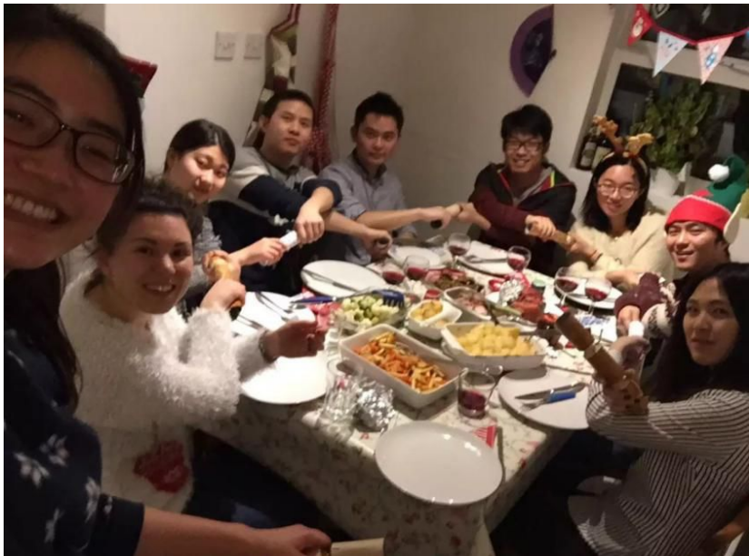
与诺丁汉当地人共度圣诞节

每年的圣诞节，最受全英人民关注的就是女王的圣诞演讲，她的演讲也被称为“最美英音”。在讲话中，她用适中的语速，最具皇室范的英音对全世界阐述自己对今年世界大事的见解，这也让前来学习语言的人受益匪浅。这些独特的节日文化，让我们对于英国文化有了更进一步地了解。