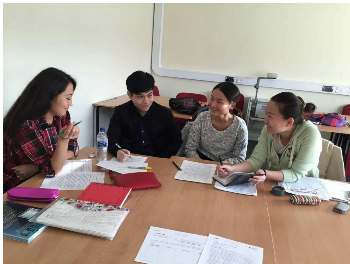
讨论问题（肯定在唠嗑~）

研究论文的考核标准：题材的完善包括全篇文本、文本章节、学术规范，论点，评论，文献使用和语言使用包括词语、语法以及关联等。