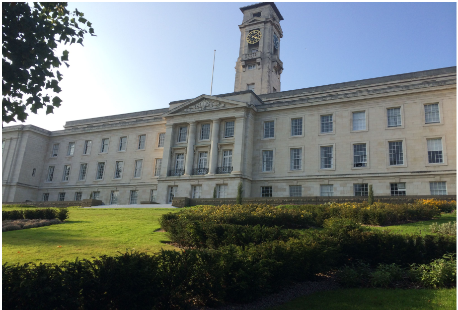
诺丁汉大学教学楼