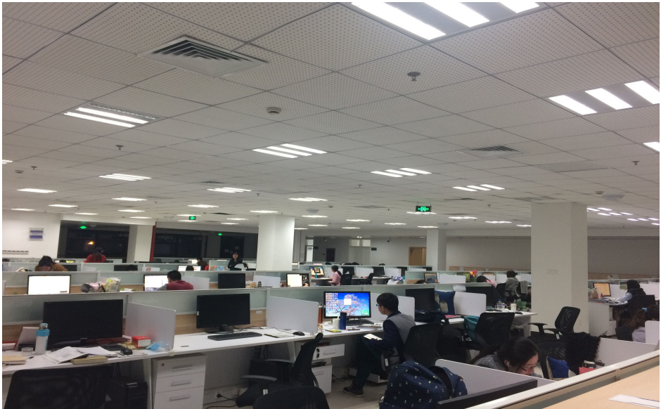
学院实验楼数据处理中心