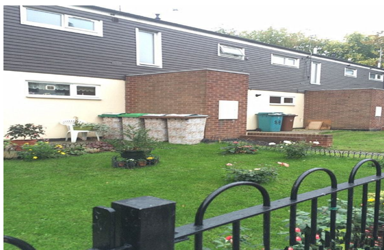
英国人家中的花园