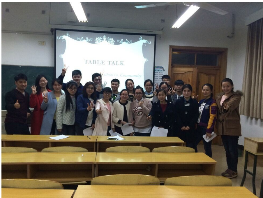
语言科学与艺术学院英语角