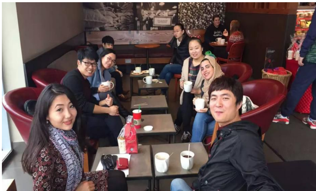
课程结束时与外国同学一起品尝下午茶