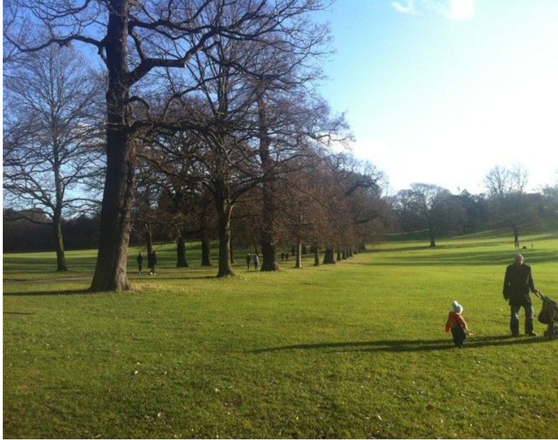
沃来顿公园的草坪

园美丽的景色中，我们与自然来了一次亲密的接触，给心灵做了一次有氧呼吸，并由衷地爱上了诺丁汉这座城市。