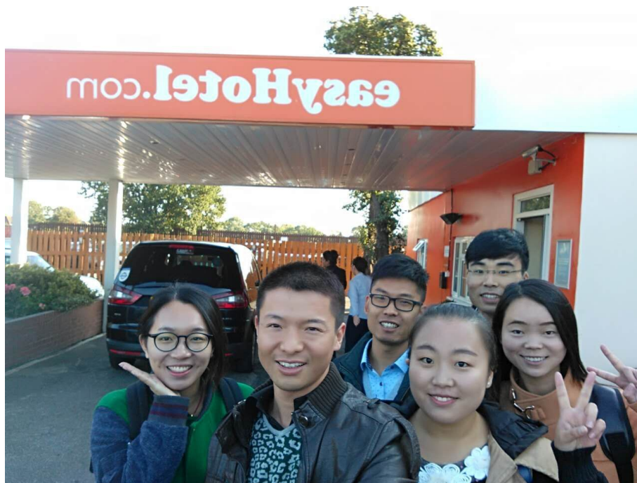
飞了 10 几个小时后仍不见疲惫的我们

如果想要出去游玩，可在市中心的 Coach Station，乘坐 National Express 到达几大著名城市，如伦敦、伯明翰、曼彻斯特等，也可选择在 Train Station 乘坐火车前往。经历了十周短暂又难忘的留学生活的洗礼，同学们相信在今后的工作和学习生活中，不管遇到什么问题，都能从容自信地面对，更加乐观开朗的心态面对每一天！