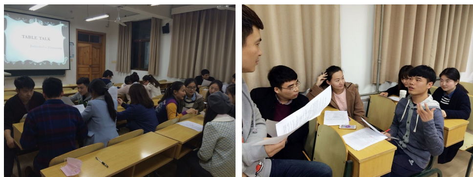
语言科学与艺术学院英语角

回国之后，我们决定将 Table Talk 进行到底。在学院教师的支持下，我们举办了每周一次的英语角活动。英语角不仅丰富了院里同学们的课余生活，同时也调动了大家学习英语的兴趣，同学们纷纷表示很喜欢这种学习英语的形式，都踊跃地参加到活动中来。