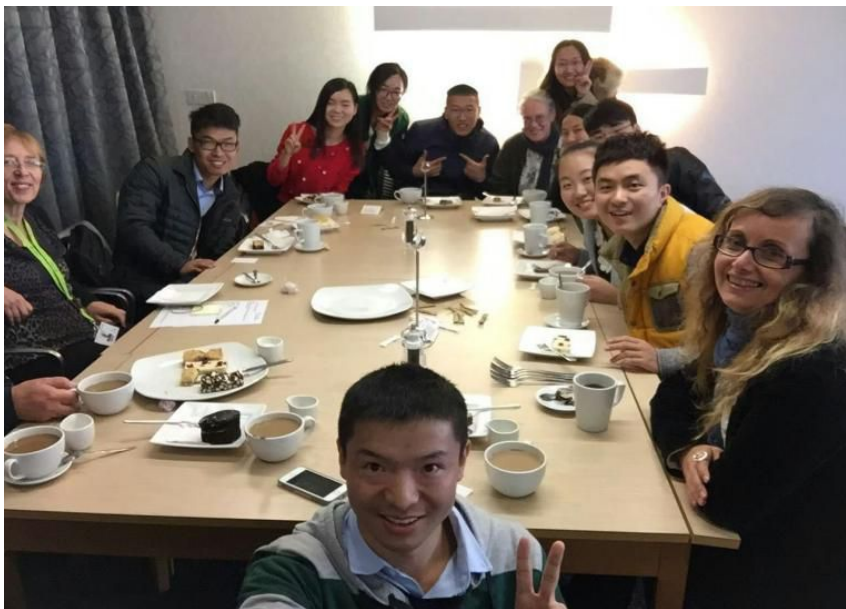
欢迎茶会上我们与教师合影留念