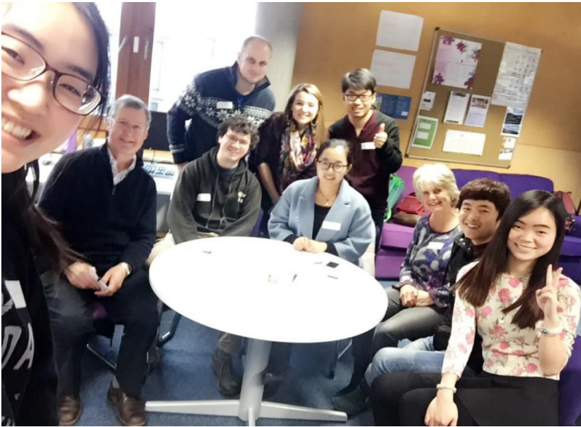
在 Table Talk 与外国友人合影留念

留英期间，我们也参加了由诺丁汉当地的志愿者们在诺丁汉大学内部创办的“Table Talk”。“Table Talk”这个词组，可以将它翻译成“席间漫谈”。它以轻松快乐的方式让我们和外国人交流。英语对于我们研究生来说，认识它很久了，对它熟悉又陌生，刚接触时觉得有意思，如今觉得不好意思，总是纠结于说不好，窘困得说不出。而这个活动，为我们提供了说英语的机会，让我们在愉悦的状态下练习口语，突破蹩脚的英语。更重要的是，它为我们提供了和英国当地人民交流思想的平台，通过交流，我们更加了解英国的文化，而外国朋友也在与我们的交流中更好地了解中国，了解中国人的想法，中西文化在这里得以融合，谱写了一曲文化之歌。