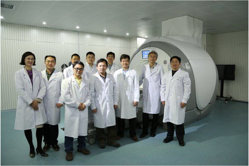
学院实验楼 fMRI 磁体间