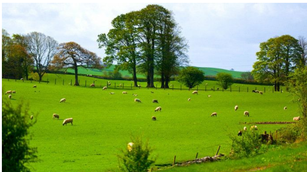
英国随处可见的大片草地

都在诉说着小镇的古典与恬静。说到花园，不得不提到英国人对园艺的特殊感情。我们在诺丁汉的三个月，深刻感受到了英国人对花园的热爱。在这里，不管贫富与否，屋舍大小，几乎每家每户都会有自己的小花园，里面种上喜欢的花卉草木，时常修剪，一年四季芬芳不歇。如果谁家的院子里杂草丛生，那么主人便会被认为很懒惰。一方面来说，喜欢打理花园体现了英国人别致的生活情趣；从另一方面说，这更体现了英国人骨子里对自然，对生命的热爱。我们在这样的氛围中，体验到的不仅是与中国存有明显差异的异国习俗，更多的是人与自然和谐相容的状态，而这正是我们需要学习英国人的地方。