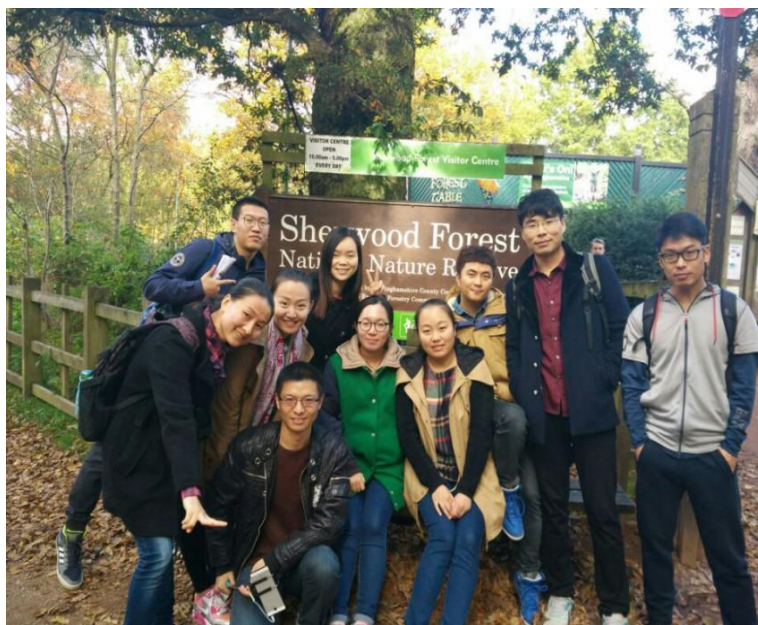
舍伍德公园前合影

的自然保护区。森林里到处是拥有几百年历史的合抱大树。不过森林里游人并不多，除了树还是树，所以更显得人迹罕至，给人一种阴森森的感觉。往深处走，森林中心还有棵巨大的、枝桠繁盛，据说约有 800 年树龄的古橡树。因为树龄太大，所以现在古橡树的枝桠都被树桩固定住了。传说罗宾汉和他的兄弟们就是在这棵树下邂逅的，而现在这棵树已经被视为罗宾汉的精神之树。在这里，几乎所有的景点都是围绕罗宾汉这个人物展开。在展览馆中，导游还向我们热情地讲解了罗宾汉的故事，我们也深切体会到了诺丁汉人民对罗宾汉的热爱之情。