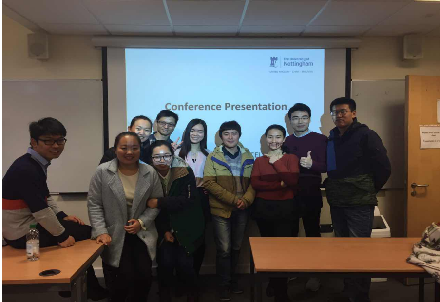
会议演讲结束后合影

会议演讲的考核标准：与观众互动，观点展现，分析深度，评估和综合，论据和论点，总结和推论，文献使用，词汇使用，语法和发音。