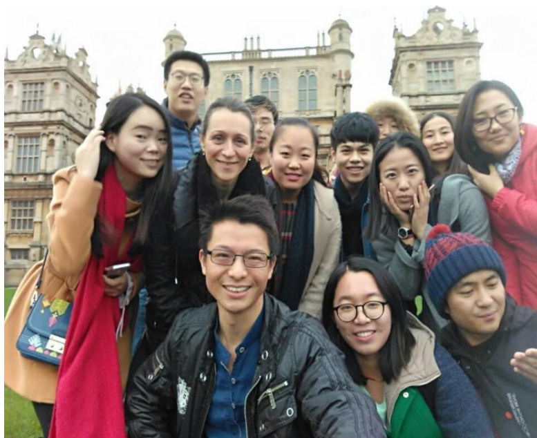
沃来顿城堡前合影

空气清新，非常安静惬意。在这里，我们还很幸运地看到了野生鹿群，小鹿们撒腿狂奔的样子让人忍俊不禁。往公园里走，在草地尽头，就可以看到树木掩映下的沃来顿城堡。蝙蝠侠系列电影的最新一部《黑暗骑士崛起》中的韦恩庄园正是取景于此。这是一幢极尽奢华的伊丽莎白时期的建筑作品，城堡的外墙上遍布着精美的花纹与头像雕刻。据说沃来顿庄园前主人喜欢收藏野生动物和矿物标本，后人将收藏品连同庄园一道交给了政府。现在，沃来顿城堡成了一座小小的“自然博物馆”，常有附近小学的教师带领学生来此“开眼界”。