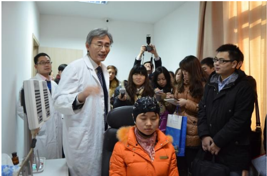
学院实验楼 ERP 实验室

刊，入选国家社科基金首批资助期刊。学院牵头创建了江苏省级、全国有影响的“语言能力协同创新中心”。学院神经语言学研究团队承担了 2014 年由教育部和江苏省政府与联合国教科文组织合作主办的，以“语言能力与人类文明和社会进步”为主题的首届世界语言大会的主要筹备和策划工作。2015 年 11 月，牵头成立了中国语言智库联盟，出版了中国首部服务“一带一路”的《“一带一路”沿线国家语言国情手册》。