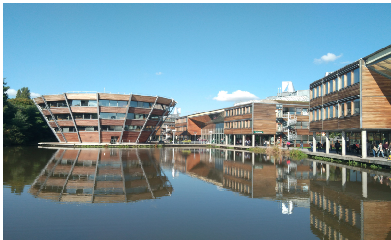
诺丁汉大学猪不理校区（Jubilee Campus）图书馆

英语语言教育中心（Centre for English Language Education, CELE）隶属于诺丁汉大学教育学院，1986年由 Ron Cater 教授创办。中心在学术英语课程、学术写作和专业英语课程方面有超过 20 年的教学经验。中心的宗旨是为帮助学生在开始学位课程前后以及未来职业方面，提高其英语综合能力和跨文化交际能力。