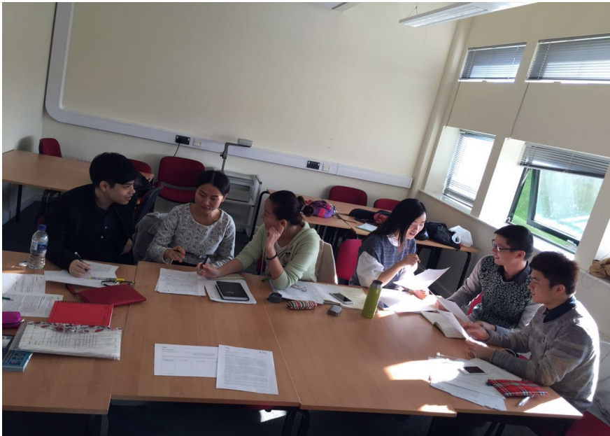
同学们正在热烈地讨论各自的论文观点

考核标准：文本内容和听众，个人观点的呈现，文本组织，参考引用，分析评估他人观点，建立与他人观点的联系，解释个人观点的发展，词语、语法和关联。