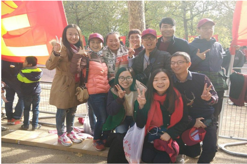
十位研究生参加习大大访英欢迎活动